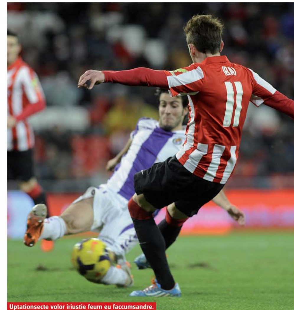
Uptationsecte volor iriustie feum eu faccumsandre.